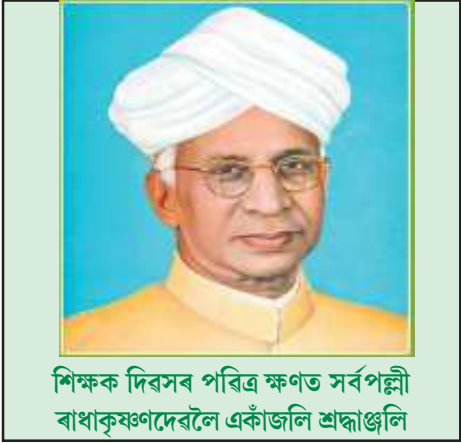
শিক্ষক দিবসৰ পৰিৱৰ্ত্তিত সৰ্বপল্লী ৰাধাকৃষ্ণণদেৱলৈ একাঞ্জলি শ্ৰদ্ধাঞ্জলি